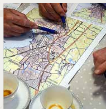
Vi bevakar politiken och lämnar remiss-svar på planer