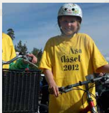
Åsaflåset körs varje försommar