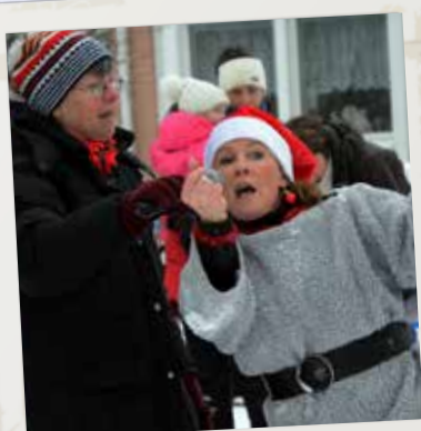
Julgransplundring med dans kring granen

I Åsbro startades för några år sedan en studiecirkel om den egna översiktsplanen. Deltagarna trivdes med arbetet och när översiktsplanen var klar bildades Åsbro Intresseförening. Syftet med föreningen var att fortsätta med planarbete samt att locka fler invånare till orten. Med tiden har verksamheten breddats.