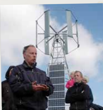
Studieresor till El-kullen, Järnboås, med mera