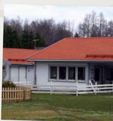
Vi arbetar för bostadsbyggande och ökad inflyttning