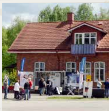
Åsbrodagen – ett återkommande arrangemang