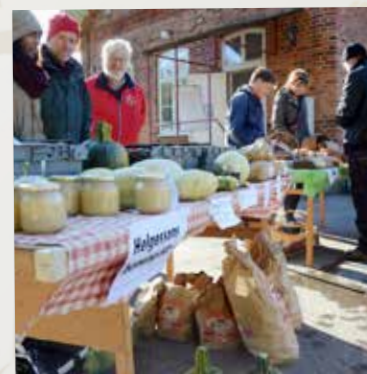
Skördemarknad utanför stationshuset